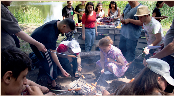
Pique-nique avec l'équipe du Centre EMAYC